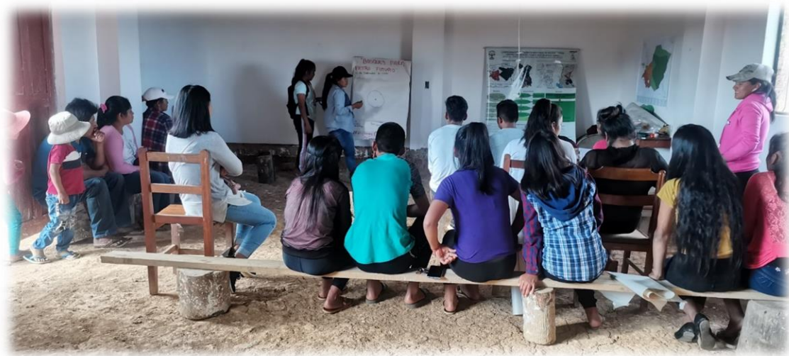
Foto 3. Facilitadores desarrollan taller de estrategias en la U E Pucasucho.