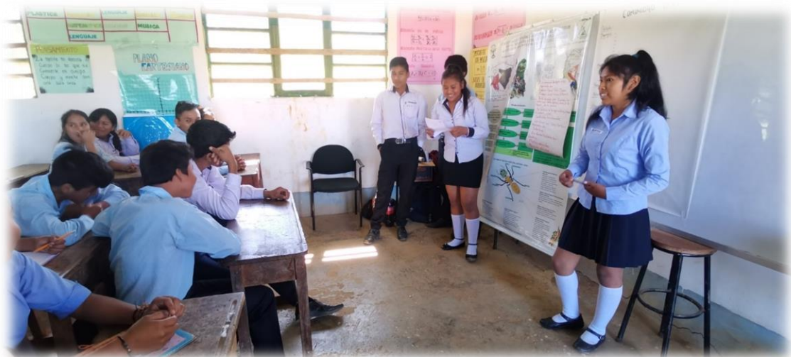
Foto 4. Jóvenes de la U E Irimo exponen sus preocupaciones en la comunidad