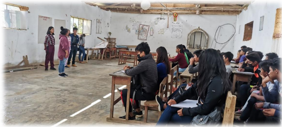
Foto 2. Facilitadores desarrollan taller de estrategias en la U E Puchahui.