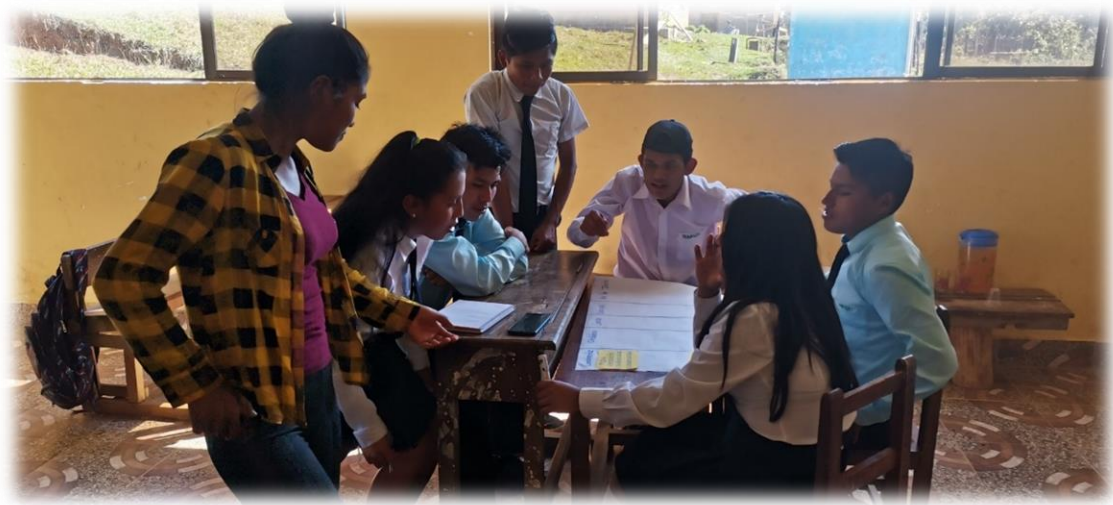
Foto 5. Jóvenes de la U E Mulihuara elaboran estrategias de gestione territorial.