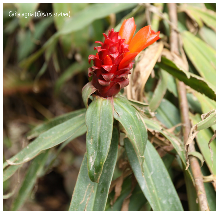
Caña agria ( Costus scaber )