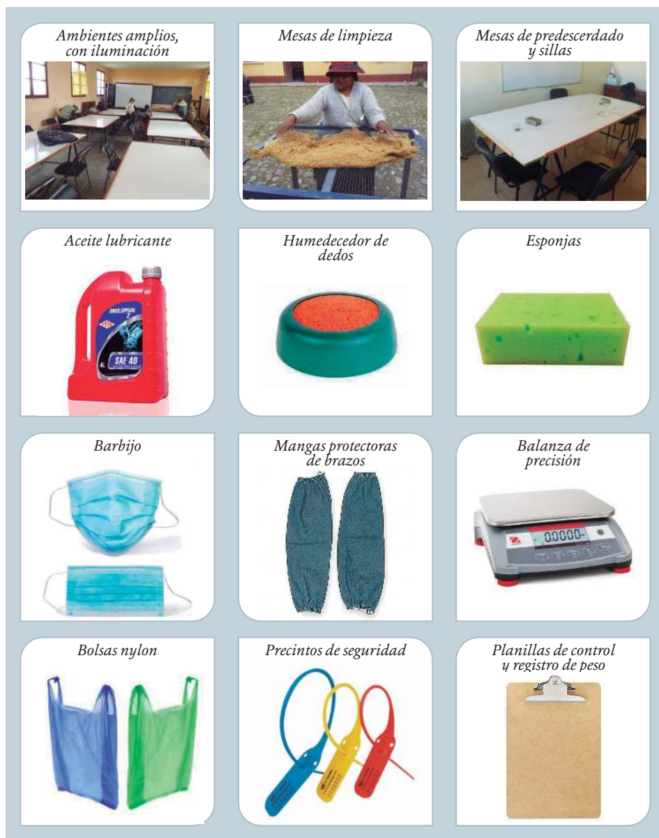
Figura 1. Materiales, equipos, insumos e infraestructura necesarios